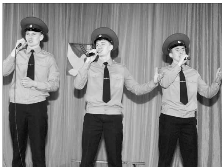
Поют курсанты Курганского пограничного института