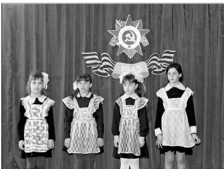
Стихи читали о войне (с. Ильино)