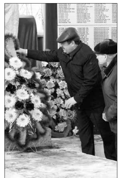
Вечная память Героям