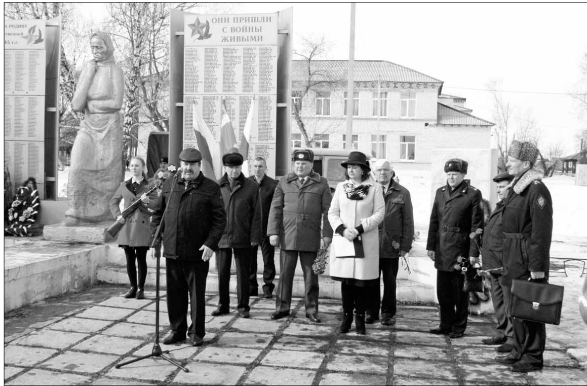
Торжественный митинг в парке Победы

- Наша история не должна быть переписана, а заслуги советского солдата, воина-освободителя мира от коричневой чу-