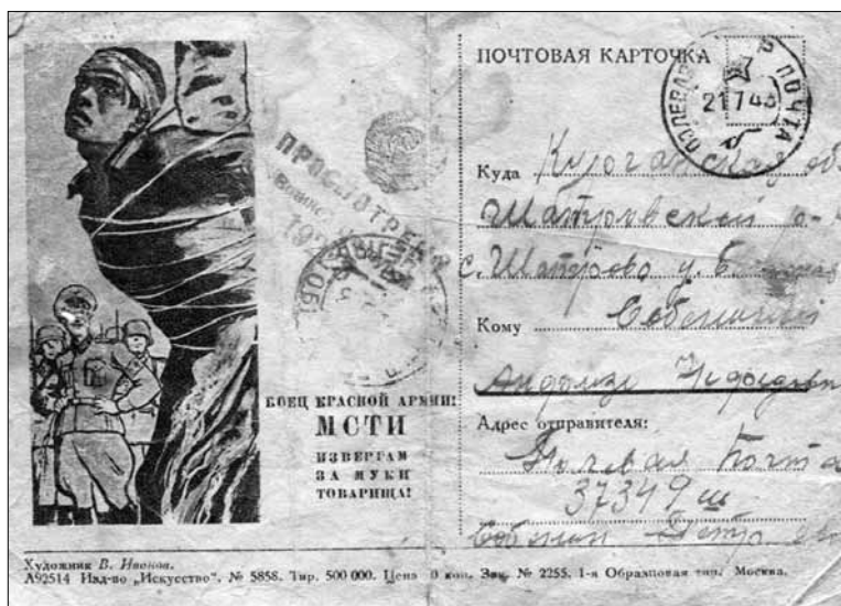
Открытка с фронта, отправленная 21 июля 1943 года