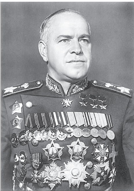
Маршал Жуков Г. К.

Районный центр Щучье – небольшой городок в Зауралье, но и в его истории есть замечательные даты. Одни из них связаны с посещениями нашего провинциально-го города людьми, ставшими известными всей стране, благодаря своим героическим подвигам во время Великой Отечественной войны. Хочется рассказать о них, чтобы молодое поколение знало об этих героях, приблизивших Победу.