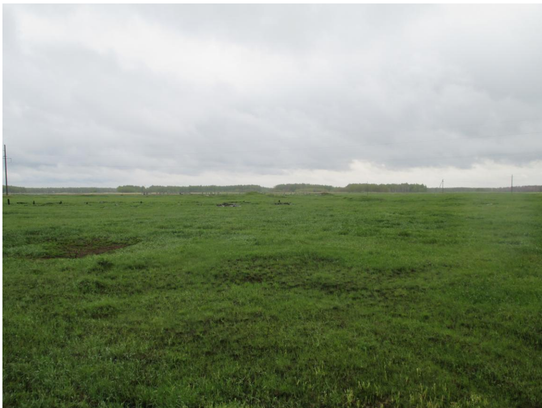
Приложение 2.1. Фотофиксация участка размещения объекта экспертизы.