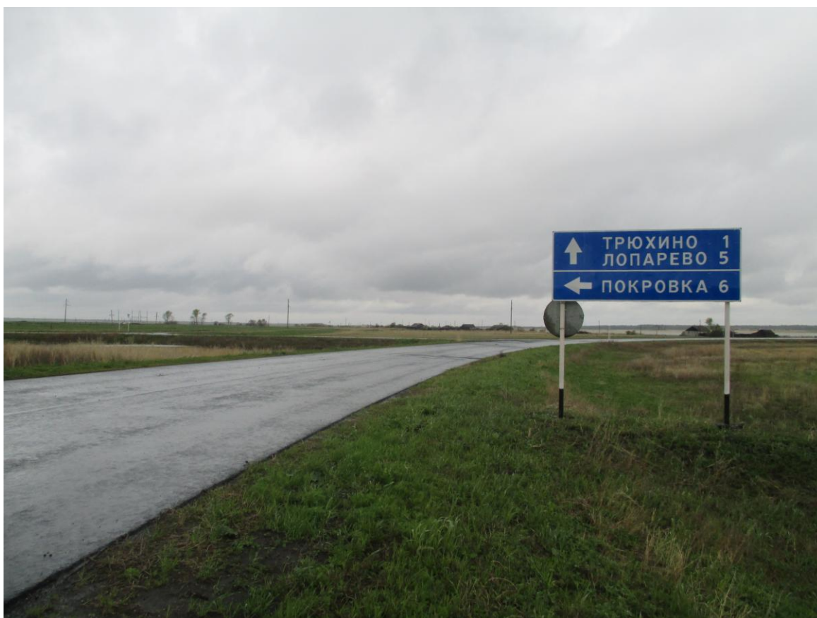
Приложение 2.2. Фотофиксация участка размещения объекта экспертизы.