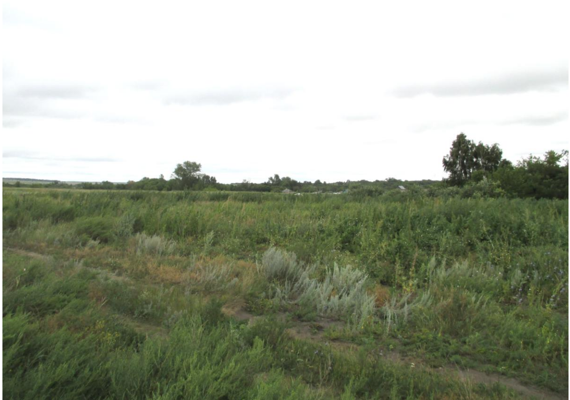
Приложение 2.2. Фотофиксация участка размещения объекта экспертизы.