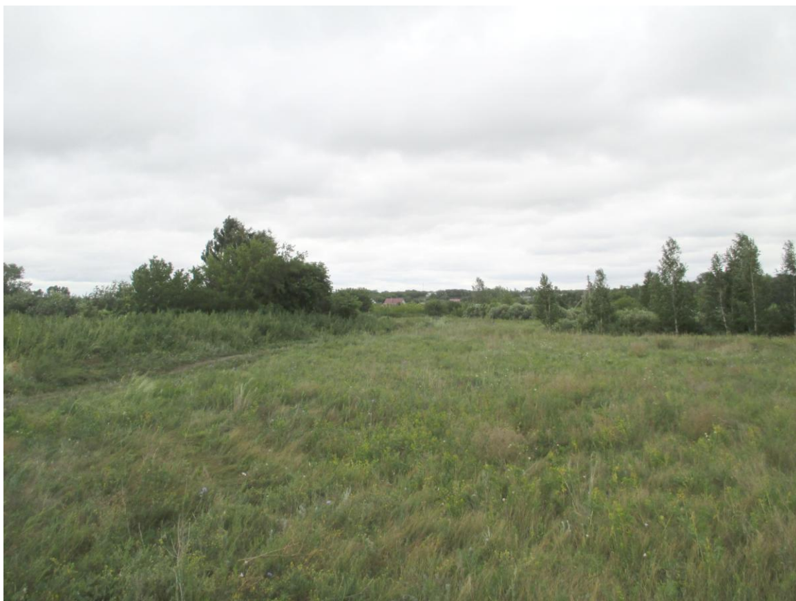
Приложение 2.1. Фотофиксация участка размещения объекта экспертизы.