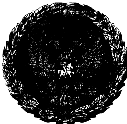
РИСУНОК НАГРУДНОГО ЗНАКА К ПОЧЕТНОЙ ГРАМОТЕ ПРЕЗИДЕНТА РОССИЙСКОЙ ФЕДЕРАЦИИ

Утвержден Указом Президента Российской Федерации от 11 апреля 2008 г. N 487